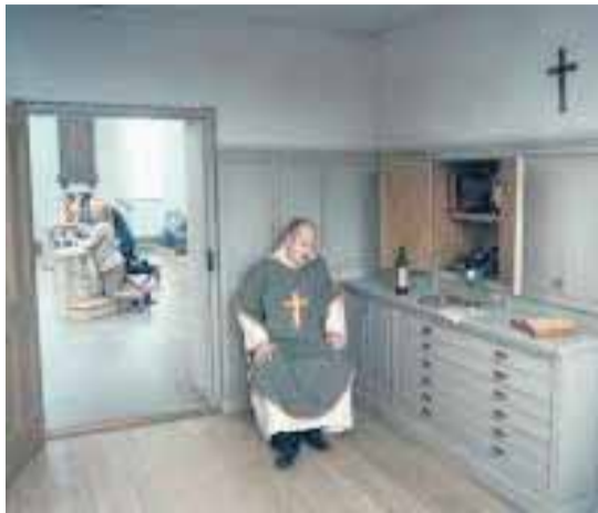
Sobre lo infinito.