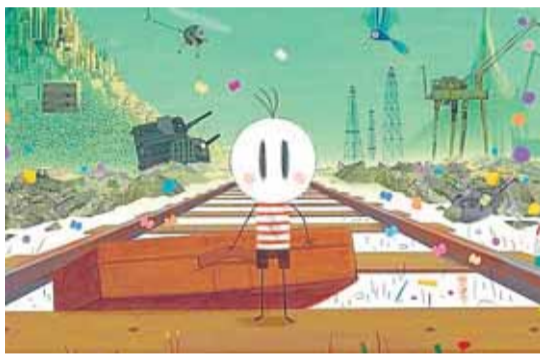
El niño y el mundo.