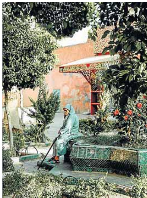
'Las flores se deshojan aunque las amemos', de Isaac Flores.