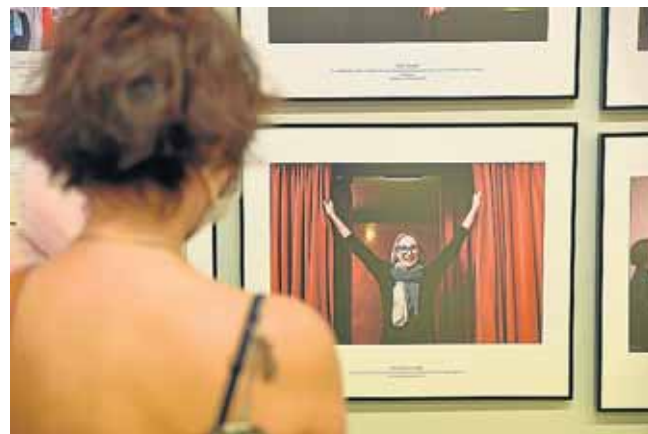
Una de las espectadoras que vio la exposición ayer por la mañana.