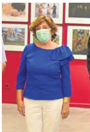
María Victoria Broto.