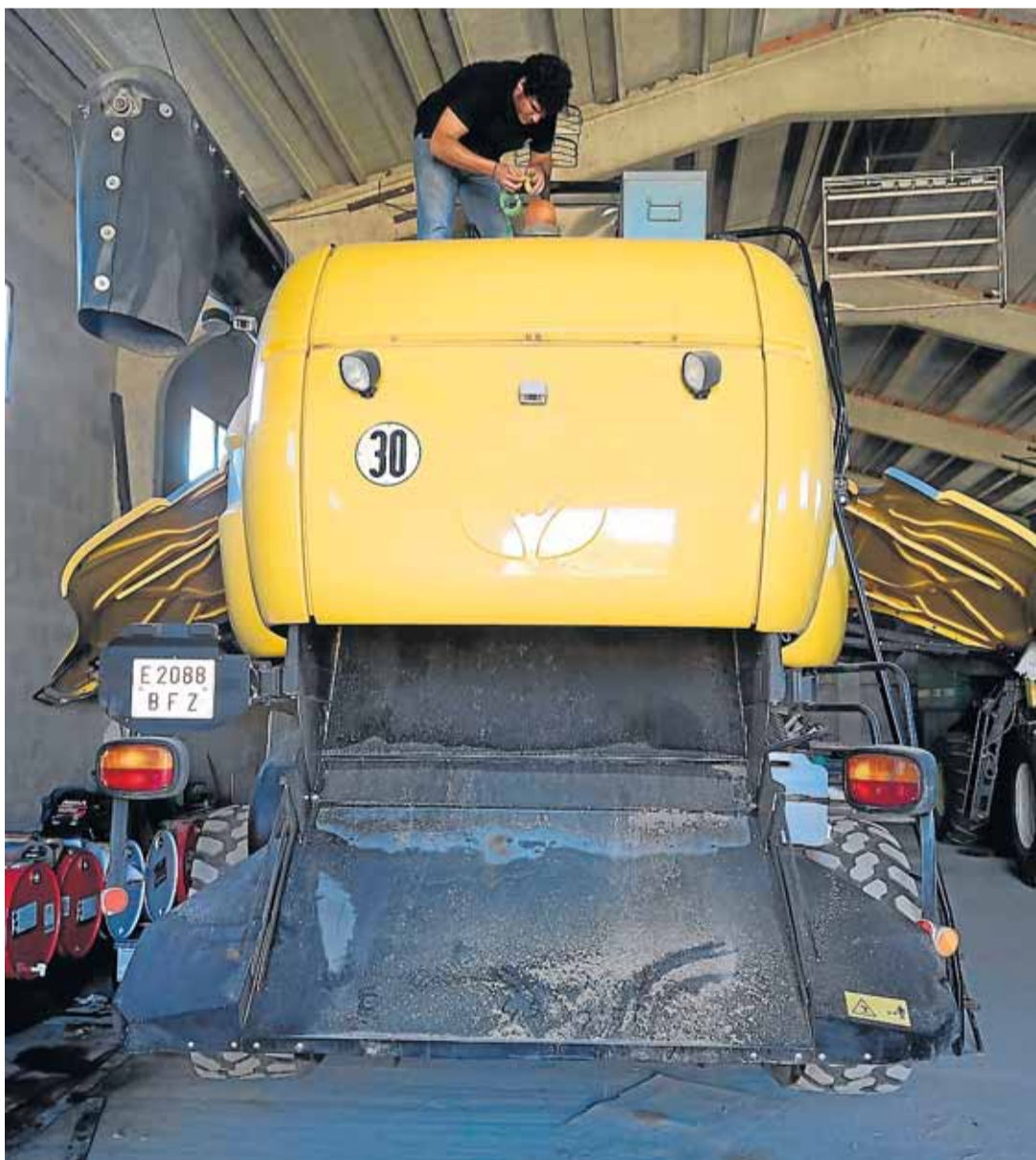
LABORATORIO DE MAQUINARIA AGRÍCOLA EPS