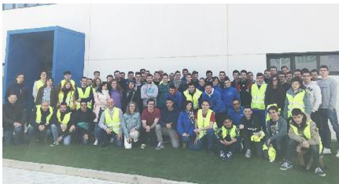
Los estudiantes de ingeniería de la EUPT posan a la entrada de la empresa Röchling Automotive

Aunque la empresa desarrolla productos en el ámbito industrial, médico y de automoción, en Teruel se ha especializado en este tercer sector, por lo que la