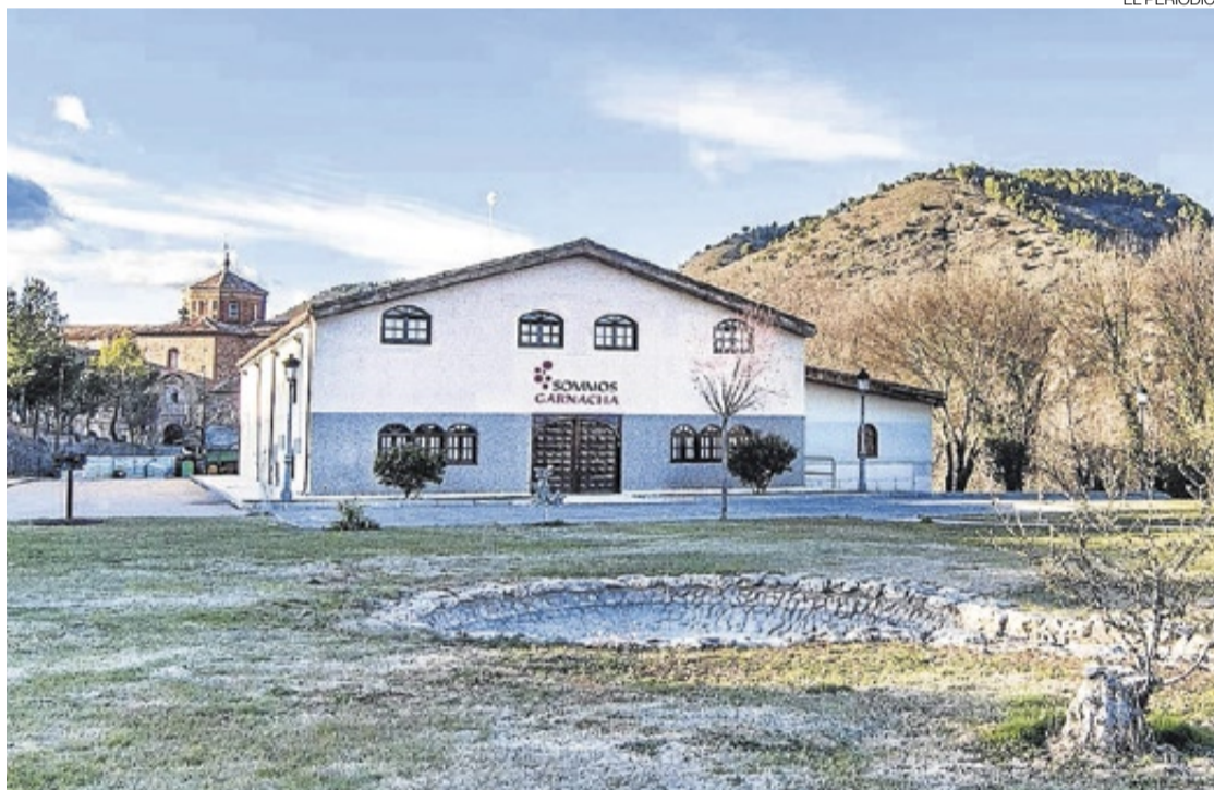
► Instalaciones de la bodega Sommos Garnacha, ubicada en Murero, que se integrará en la DO Calatayud.

La iniciativa surgió a petición de Sommos Garnacha (antes Vi-