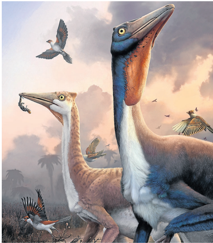
Pelecanimimus, por el paleoartista Hugo Salais. FUNDACIÓN DINOSAURIOS CYL