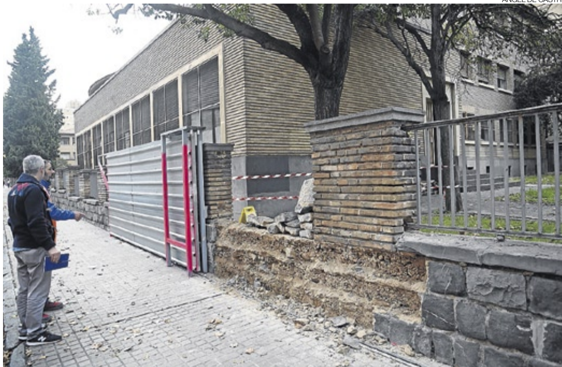
▶ Apertura de una puerta, en la parte trasera de la facultad, en la calle Pedro Cerbuna.

El vallado y la protección de Filosofía, tras haber hecho ya a finales de septiembre el estudio de seguridad y el plan de emergencia de las obras, es el paso previo a los trabajos y el derribo del pabellón de Filología, que tiene que ser totalmente derruido. Esto está previsto para el 10 de diciembre.