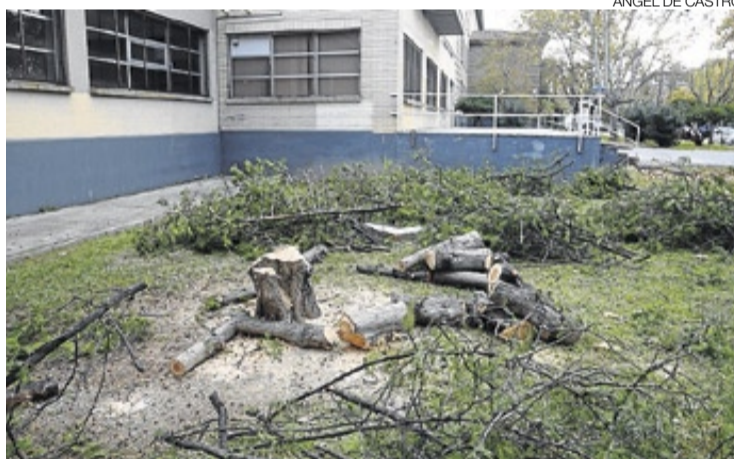
▶ Árboles cortados y podados en la zona de Filosofía, ayer.

Mientras tanto, los 3.000 alumnos y 400 docentes de Filosofía ya iniciaron el nuevo curso en otras estancias como el colegio Cervantes, la antigua Facultad de Educación (en cuya puerta de entrada se puede leer Facultad de Filosofía y Letras) o instalaciones de facultades próximas como Ciencias o Interfacultades, ambas en el campus.