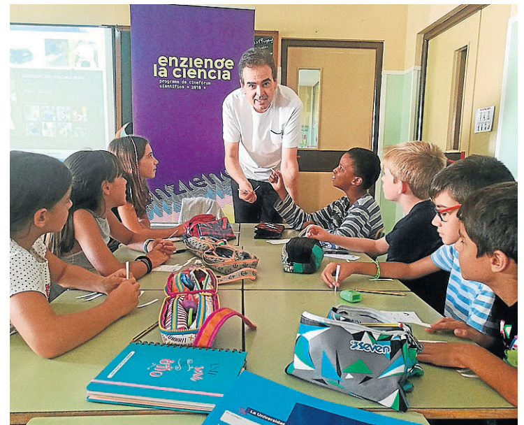
Escolares del CEIP La Estrella de Zaragoza, durante la actividad.

Charlando con investigadores Esta herramienta de divulgación ofrece a los escolares la oportunidad de charlar, cara a cara, con investigadores aragoneses, en un ambiente relajado y divertido pero con una intención muy clara y precisa: despertar en ellos, a eda-