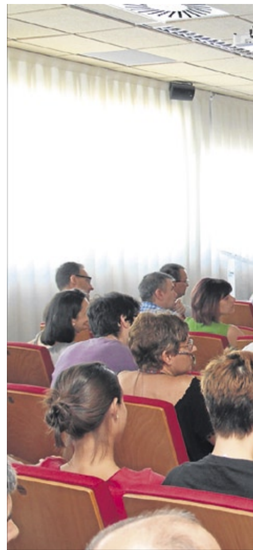
Asamblea de investigadores de la Universidad

De cara a la Conferencia de Rectores de las Universidades Españolas (CRUE) se solicita que coordine y lidere «una respuesta pública» contra esta situación y que traslade la inquietud generaliza-