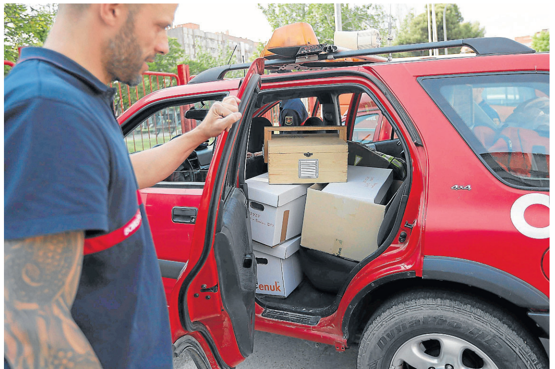
Los Bomberos de Zaragoza se preparan para un servicio de recogida de enjambres.