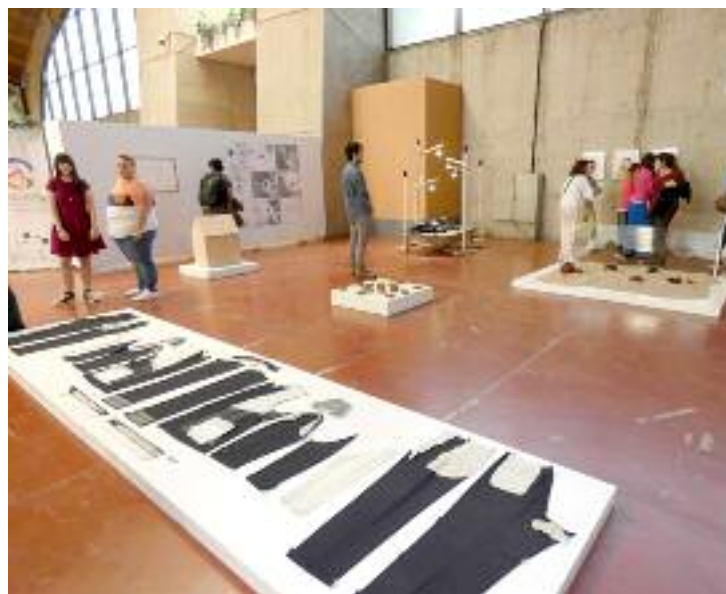
El festival Garbo es otro de los atractivos de Juventud Activa