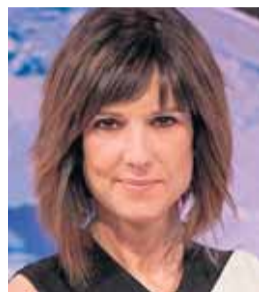
Mónica López, meteoróloga y presentadora de televisión, 43.