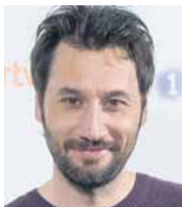
Raúl Fernández, actor, 43.

Pat Benatar, cantante, 65. Iker Jiménez, periodista, 45. Dennis Cooper, escritor, 65. Evan Handler, actor, 57. Walter Hill, director de cine, 76. Donald Fagen, músico, 70. Nathan Moore, cantante, 53. Sarah Shahi, actriz y modelo, 38. Ana Bárbara, cantante, 46. Zuria Vega, actriz, 29. Cash Warren, productor de cine, 39. Valerie June, cantautora, 36.