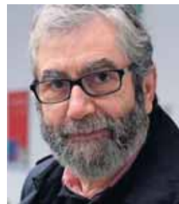
Antonio Muñoz Molina, escritor, 62.