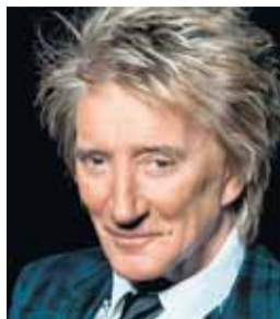
Rod Stewart, cantante, 73.