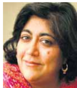
Gurinder Chadha, directora de cine, 58.