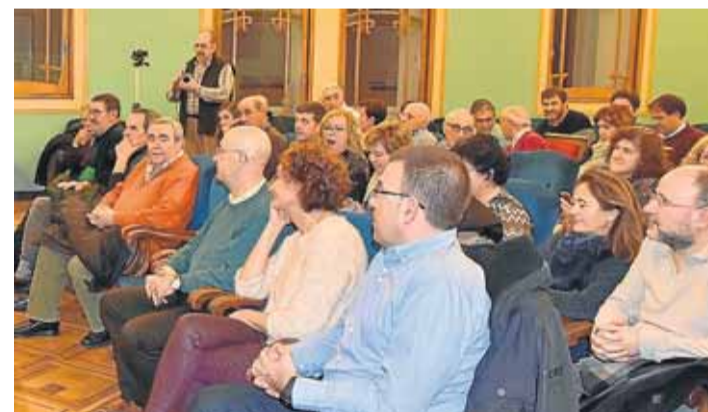
Asistentes a la mesa redonda celebrada días atrás en el salón azul del Casino de Huesca.

●●● Hasta el próximo mes de mayo, los distintos protagonistas de la historia de la Universidad Laboral irán pasando por las distintas mesas redondas organizadas para ver la evolución tanto de los servicios (25 de enero), residencia y actividades extraescolares (22 de febrero), repercusión socioeconómica del centro (22 marzo), deporte (26 de abril) y arquitectura del edificio que, recordemos está catalogado como Bien de Interés Cultural del Patrimonio Aragonés por el Gobierno de Aragón (28 de marzo). Las mesas finalizarán el 26 de mayo con un encuentro de antiguos alumnos. Todos los actos, con asistencia libre, se realizarán en el salón azul del Casino Oscense a las 19 horas. ● D.A.