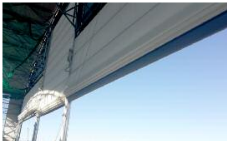
Los tres sectores de la doble lona pueden abrirse a la vez o por separado