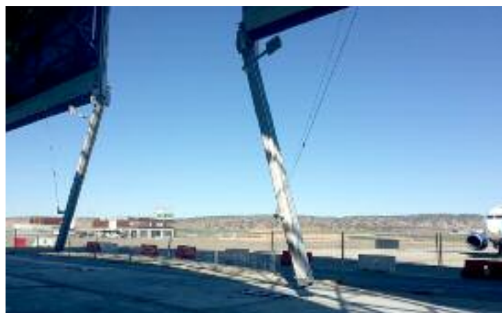
Con la lona ya plegada, las guías también ascienden para la entrada de aviones

El hangar será gestionado a partir de abril por Tarmac, que abonará un canon de 56.000 euros al año.