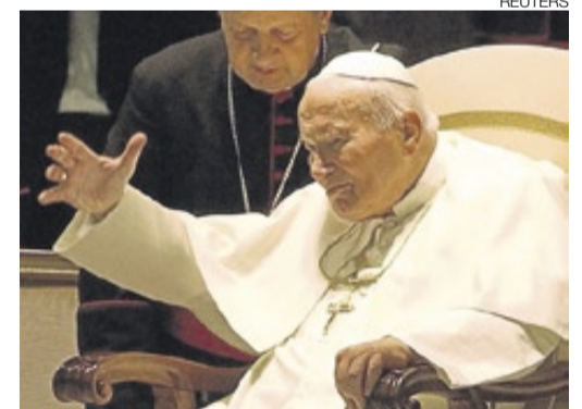
►► El papa Juan Pablo II.

«VERGÜENZA NACIONAL» // Tras conocerse estos datos, el primer ministro australiano, Malcolm Turnbull, en una intervención en el