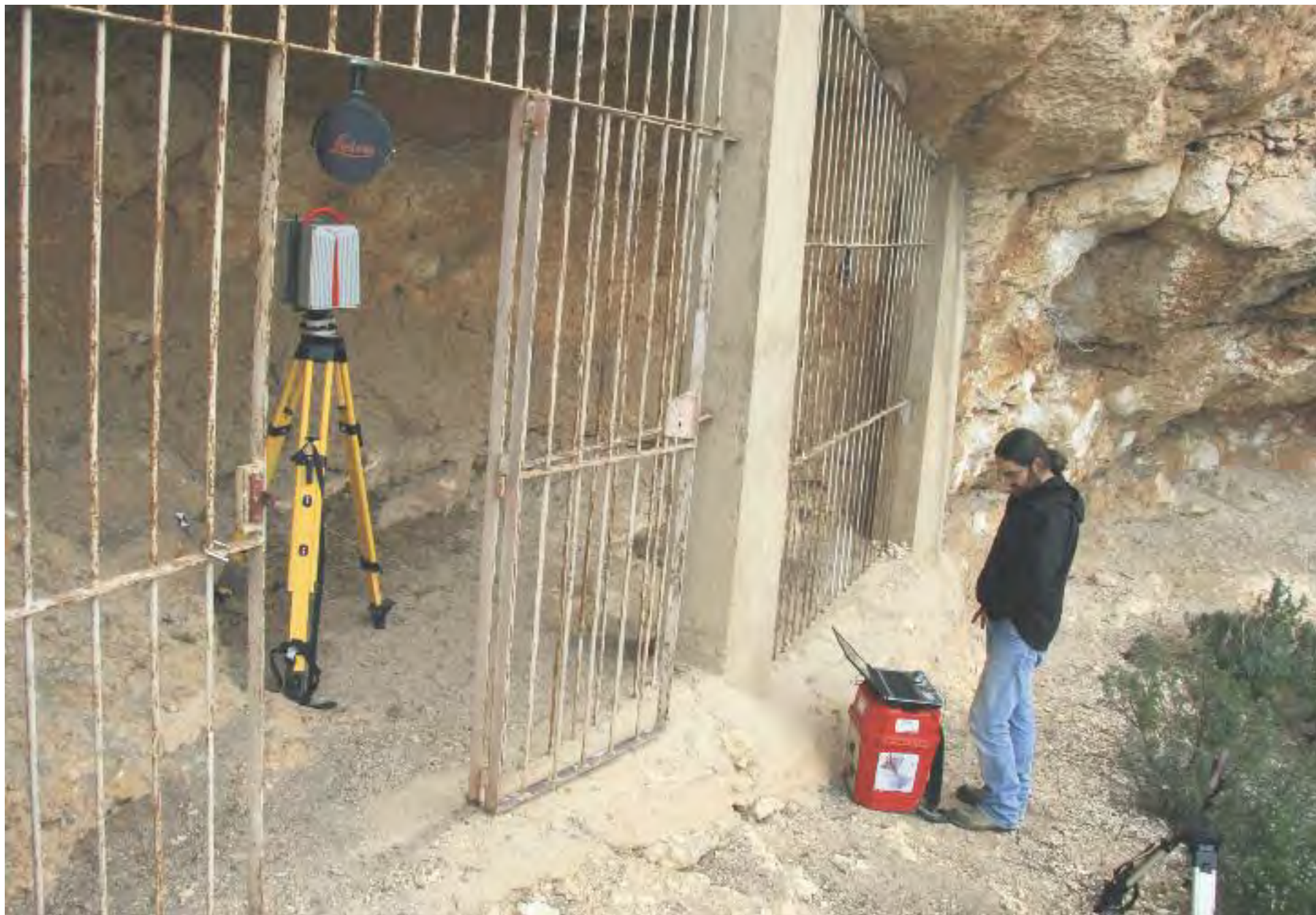
Uno de los técnicos que participa en el proyecto durante el escaneado láser del abrigo de La Vacada, en Castellote