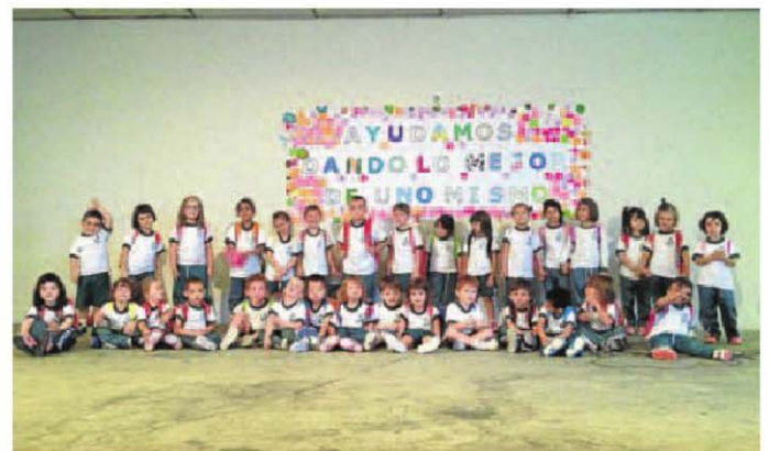
■ Los escolares de infantil, en representación de todo el colegio, posan con el cartel que expresa el lema de trabajo y análisis elegido para este nuevo curso.

Juegos, actividades y reflexión para dar la bienvenida al nuevo curso en el Colegio Sta. María de la Esperanza