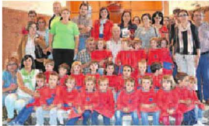
■ Escolares, abuelos y profesores, todos juntos.

Día Internacional de las Personas Mayores en el Colegio Las Viñas