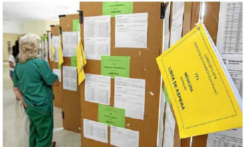
◆ RESULTADOS Se publicarán en los tabloncillos de anuncios de los centros de secundaria y en el edificio Interfacultades de Zaragoza. ASIER ALCORTA

Los estudiantes de Aragón y de otras 12 comunidades autónomas españolas se enfrentarán desde hoy y durante tres días a la selectividad o Pruebas de Acceso a la Universidad (PAU). Asturias, La Rioja, Navarra y País Vasco ya lo hicieron en la primera semana de junio.