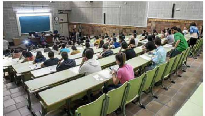
◆ EXÁMENES Comienzan hoy a las 11.15 con el ejercicio de Lengua Castellana y Literatura. JOSÉ MIGUEL MARCO

CASI 5.300 ESTUDIANTES ARAGONESES SE ENFRENTARÁN A PARTIR DE HOY A LA CONVOCATORIA DE LAS PRUEBAS DE ACCESO A LA UNIVERSIDAD, QUE SE PROLONGARÁN HASTA EL PRÓXIMO JUEVES 12