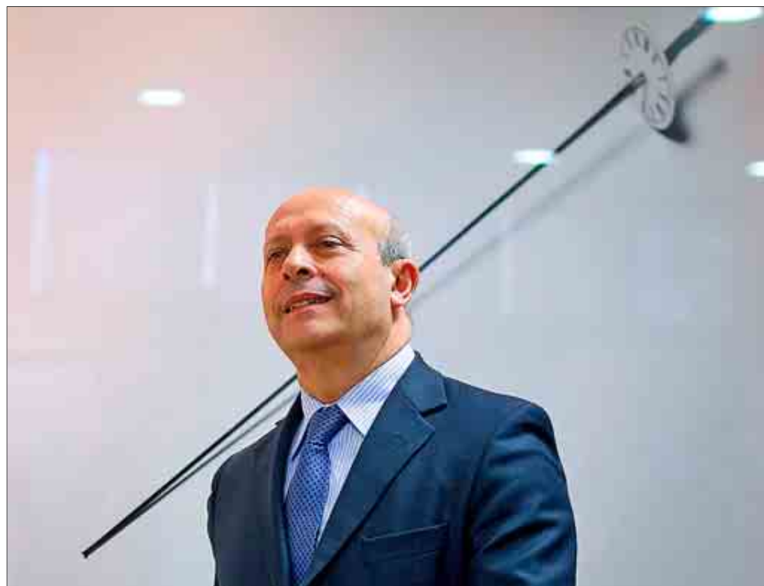
El ministro de Educación, José Ignacio Wert, ayer, durante un acto en el Consejo Superior de Deportes.

Arropado por Soraya Sáenz de Santamaría, Alberto Ruiz-Gallardón, Fátima Báñez y otros miembros del PP, Wert negó que vaya a dimitir: «Yo sólo tiro la toalla, generalmente con cierto desorden, al salir de la ducha».