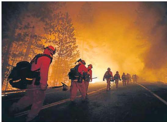
Un grupo de presos en función de bomberos junto a la autopista 120 cerca del parque de Yosemite

En California, como en otros estados del Oeste de Estados Unidos, es habitual que reclusos que cumplen condena en prisión ejerzan de bomberos cuando es necesario. Varios de estos bomberos han sido vistos estos días combatiendo las llamas la región del parque de Yosemite. Desde la Segunda Guerra Mundial, California ha ofrecido a los presos no violentos la posibilidad de trabajar, codo a codo con bomberos profesionales, previniendo y apagando fuegos. Era una manera de servir a la comunidad y preparar la reintegración en la vida civil. También de ahorrar costes al erario. Estos reclusos han llegado a representar hasta la mitad de los bomberos en grandes incendios en California, según Los Angeles Times .