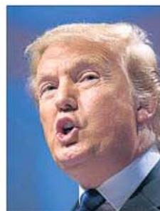
Donald Trump, en el 2011

te de estafar 40 millones de dólares a más de cinco mil personas en todo el país ofreciendo cursos con supuestos especialistas y encuentros con el propio Trump que al final nunca se materializaban. Muchos alumnos creían que asistían a una universidad verdadera e invirtieron "decenas de miles de dólares que no podían permitirse gastar por lecciones que nunca recibieron", según el fiscal