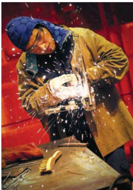
Los alumnos podrán acceder a la FP Básica a partir de los 15 años.

En 2012, esta cifra era del 24,9% (en torno a 863.000 jóvenes de entre 18 y 24 años), el doble de la media europea, a pesar de que durante la crisis se ha reducido enormemente: en 2008 era el 31,9%. El objetivo europeo "se traduce en que un 85% de los alumnos debe conseguir, en la nueva estructura educativa pro-