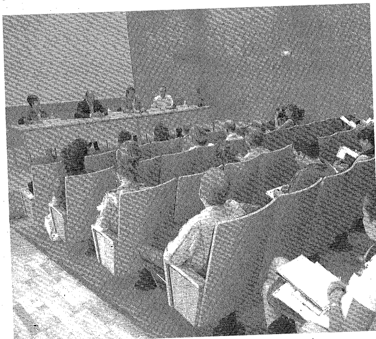
Imagen de una edición anterior del curso de Alcañiz.

Se trata también de fomentar foros de difusión y debate que refuercen la cohesión entre la Universidad y la sociedad, por lo que está dirigido tanto a investigadores sobre Humanidades en gene-