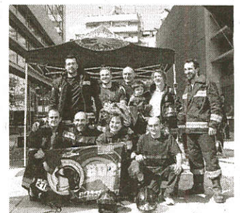
▶▶ Algunos participantes.