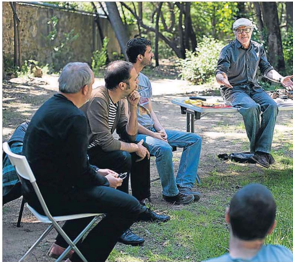
Alumnos de la Escola d'Arquitectura del Vallès de la UPC haciendo clases frente al claustro en señal de protesta, ayer

Sea como sea, las universidades tendrán que continuar recortando este año pese a sus abultados déficits. La mayoría ha aprobado sus presupuestos (ya con ajustes) sin conocer los números finales de la secretaria. La Universitat de Barcelona tenía previsto ayer celebrar un consejo de gobierno para dar luz verde a un presupuesto de 362,7 millones de euros, un 1,5% menos que en el 2012, pero la reunión se suspendió por las protestas de un grupo de estudiantes -más información en el artículo adjunto-. La Autónoma de Barcelona ha pasado de los 297 millones del año pasado a 286 este 2013, mientras que la Pompeu Fabra, la Rovira i