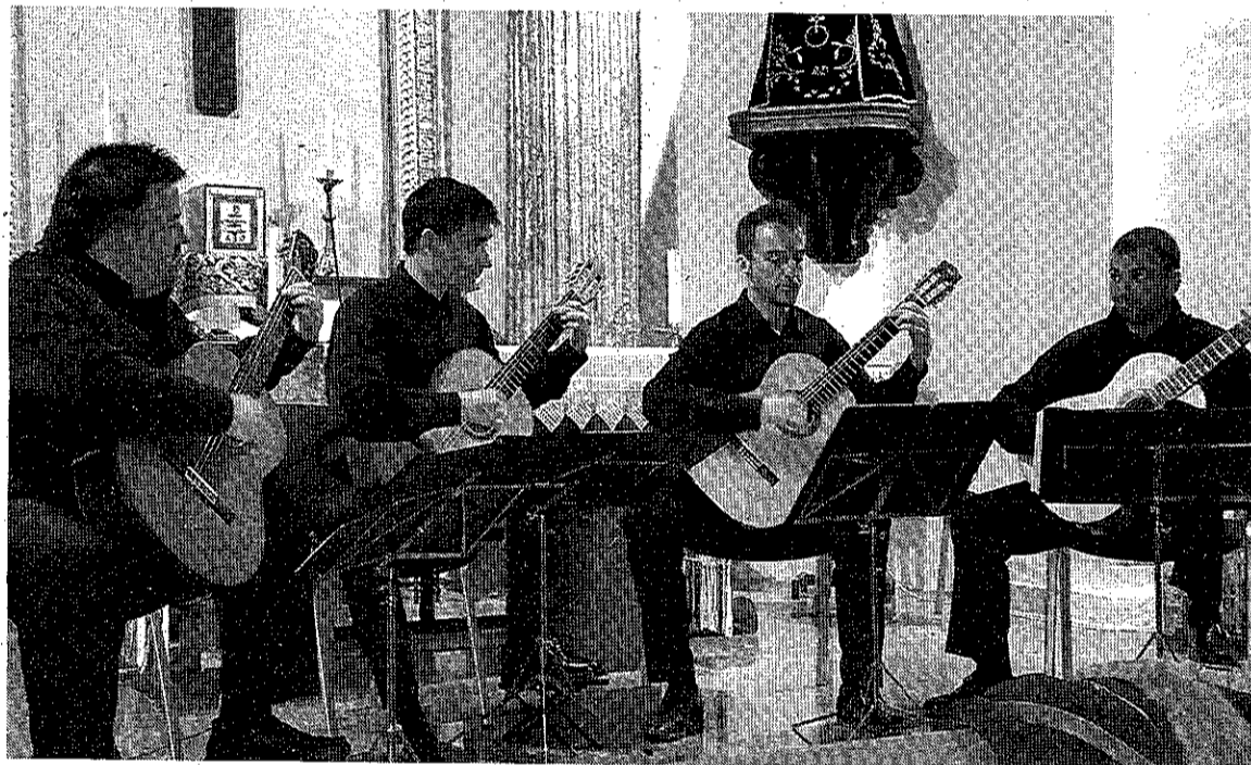
Actuación de Terpsícore en Monflorite el pasado domingo. S.E.

Se había generado mucha expectativa con el regreso de Terpsícore a los escenarios de la comarca y sus componentes no defraudaron, según indica el Área de Cul-