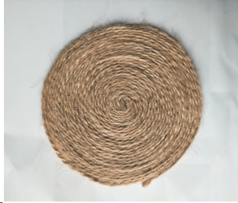
Maqueta a pequeña escala con la cuerda