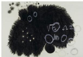
Alicia Vela. El pájaro negro (1990) Óleo sobre papel 70 x 100 cm