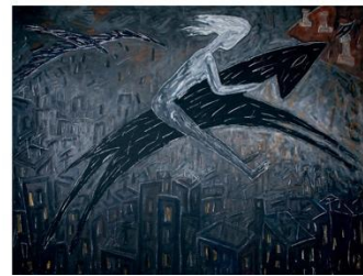
Alicia Vela. Escenarios irreales (1986) Técnica mixta sobre lienzo 200 x 250 cm